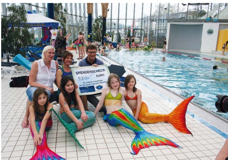
( https://archiv.samerbergernachrichten.de/maerchenhaftes-schwimmvergnuegen-im-prienavera-erlebnisbad/ )

Meldungen eines beliebigen Tages finden: